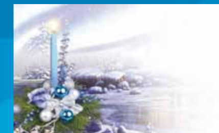
K-050 CENOVÝ KÓD A