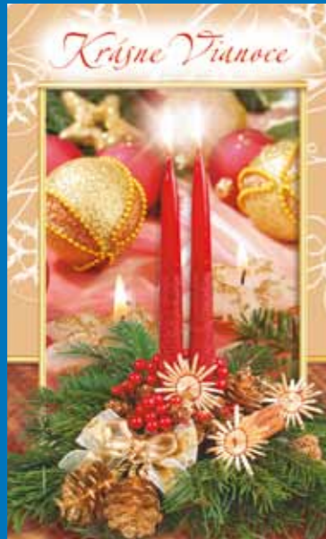
19-315 CENOVÝ KÓD B