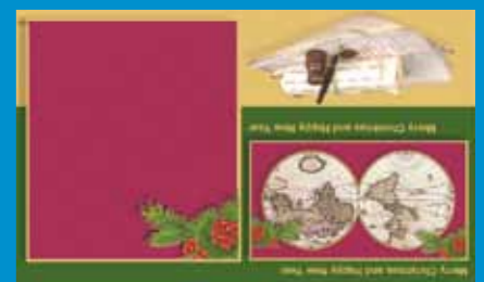
K-037 CENOVÝ KÓD A