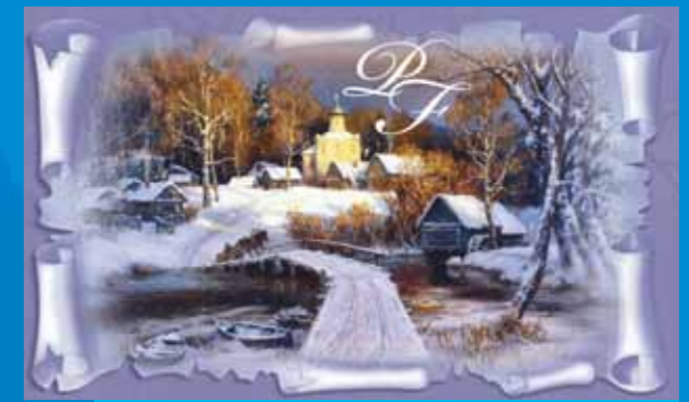
19-316 CENOVÝ KÓD B