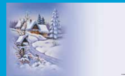
K-044 CENOVÝ KÓD A