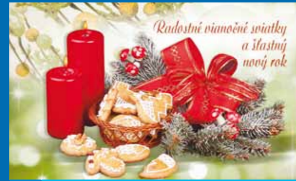
19-313 CENOVÝ KÓD B