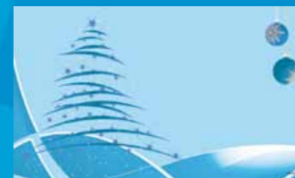
K-042 CENOVÝ KÓD A