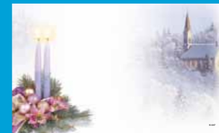
K-047 CENOVÝ KÓD A