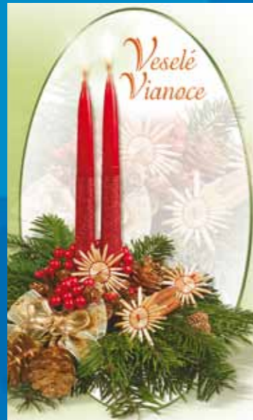
19-311 CENOVÝ KÓD B