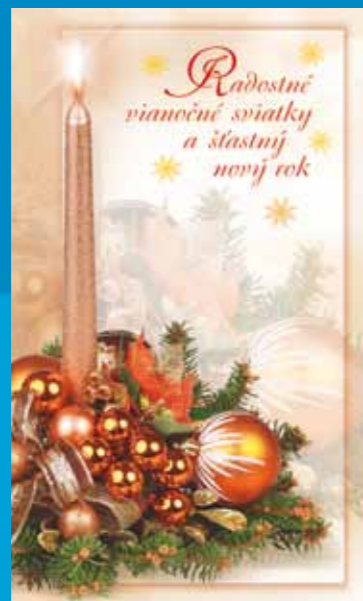
19-310 CENOVÝ KÓD B