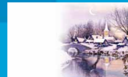
K-049 CENOVÝ KÓD A