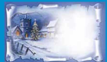
K-045 CENOVÝ KÓD A