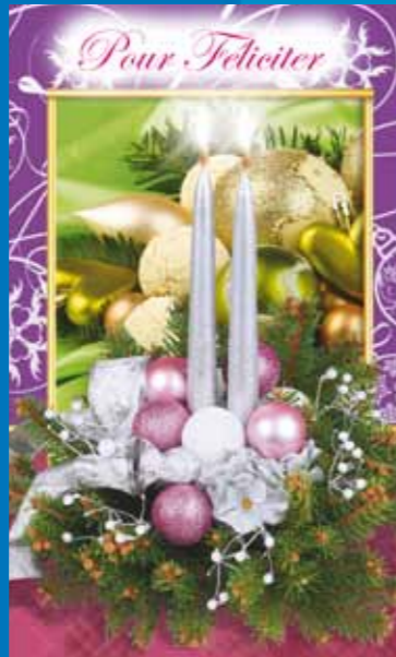
19-314 CENOVÝ KÓD B