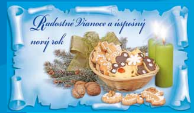
19-312 CENOVÝ KÓD B