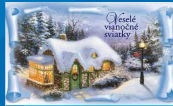
19-317 CENOVÝ KÓD B