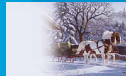
K-046 CENOVÝ KÓD A