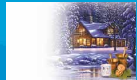
K-048 CENOVÝ KÓD A