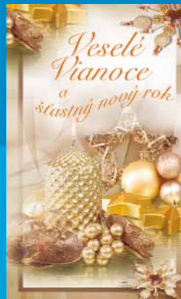
19-309 CENOVÝ KÓD B